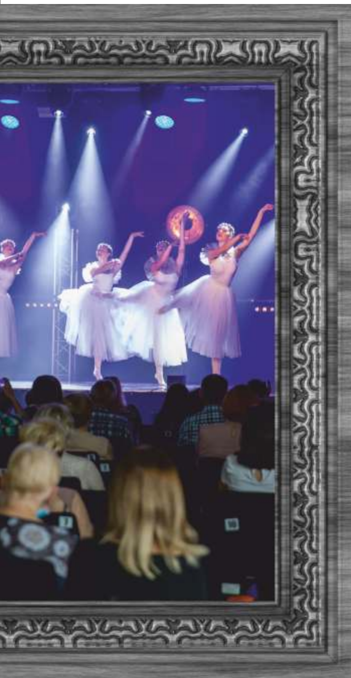
Koncert Galowy na zakończenie sezonu 2020/2021