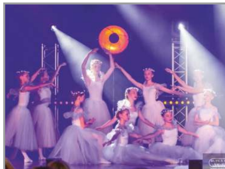
Koncert Galowy na zakończenie sezonu 2020/2021